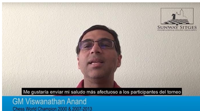
GM Viswanathan Anand Chess World Champion 2000 & 2007-2013