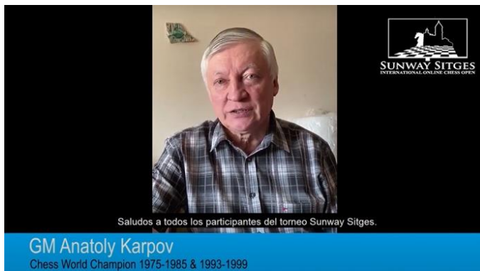
GM Anatoly Karpov Chess World Champion 1975-1985 & 1993-1999