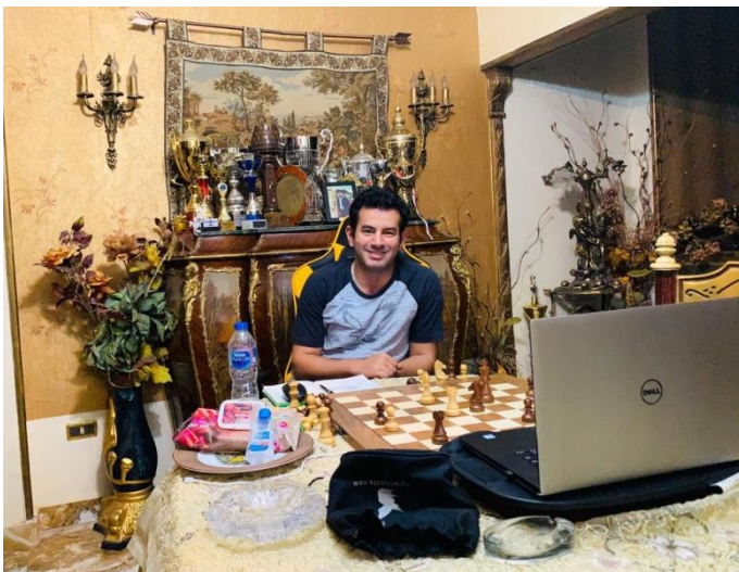
El Gran Mestre Ahmed Adly, campió del torneig

El que és clar és que el nom de Sitges ha tornat a estar en boca de tot el món dels escacs, només 4 mesos després de què ja ho estigués, en aquell cas per un incident entre un jugador iranià i un altre israelià durant la disputa precisament del torneig Sunway Sitges (presencial). Aquell incident va desembocar en la prohibició de l'Iran als seus millors escaquistes de participar en el Campionat Mundial de Ràpides de 2019, i en la renúncia del millor escaquista iranià a representar mai més al seu país.